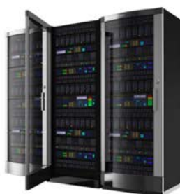
Server Saxos - PACS