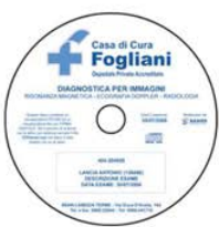
CD da fornire al Paziente