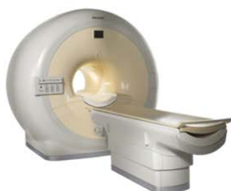
Apparecchiature DICOM RMN, TAC, RX, ECO, MOC,...

Il sistema informativo delle immagini (PACS) è responsabile delle fasi di acquisizione e memorizzazione delle immagini per fini diagnostici. La soluzione Saxos-PACS consente di interfacciarsi direttamente con le macchine DICOM di radiologia ottimizzando il percorso delle informazioni, riducendo il tempo di inserimento dati sulle apparecchiature diagnostiche e fornendo al medico radiologo un ambiente di refertazione integrato.