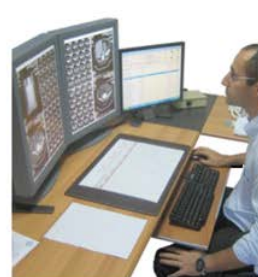
Stazione per la refertazione a Video