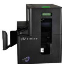
Stazione per la produzione del CD